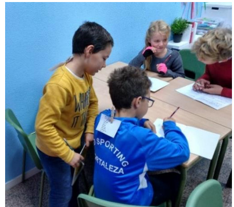
Algo distinto: un dictado en la espalda. Dile a tu compi qué palabras tiene en la espalda.

Sin embargo, a pesar de los nervios, las clases continúan. A los niños parece gustarles mucho el nuevo método de estudio de historia, biología y geografía. Aprenden haciendo experimentos, explorando y buscando por sí mismos la información, y viendo películas sobre los temas.